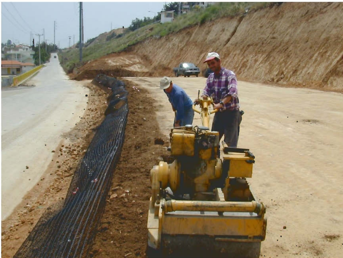
Φ8: Κατασκευή οπλισμένου επιχώματος Βορειοδυτικού ακρόβαθρου της γέφυρας της Ποτίδαιας (Ε.Ο.Α.Ε., 1513 - Νοέμβριος 2000)