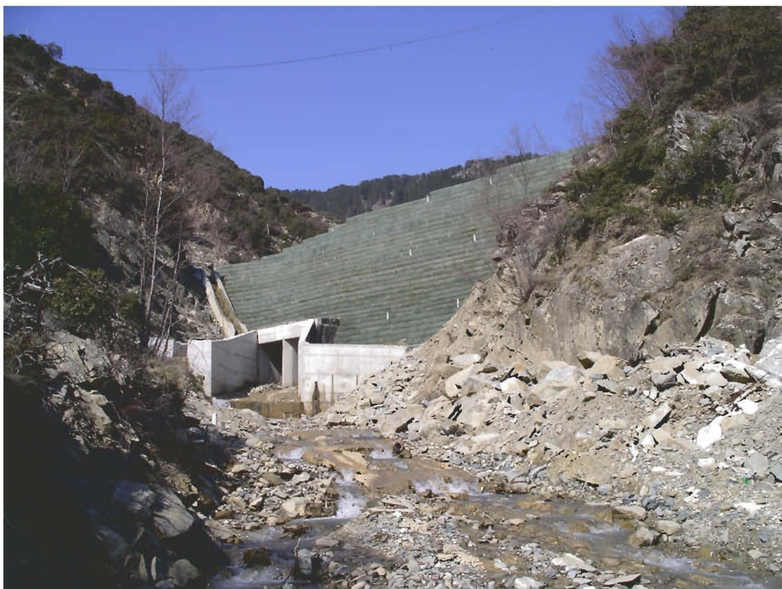
Φ24: Κατασκευή οπλισμένου επιχώματος περιοχής ελικοδρομίου στο νέο Στρατιωτικό Νοσοκομείο 424 Θεσ/νίκης. (Κ/Ξ 424 ΓΣΝΘ, 1910 – Δεκέμβριος 2002)