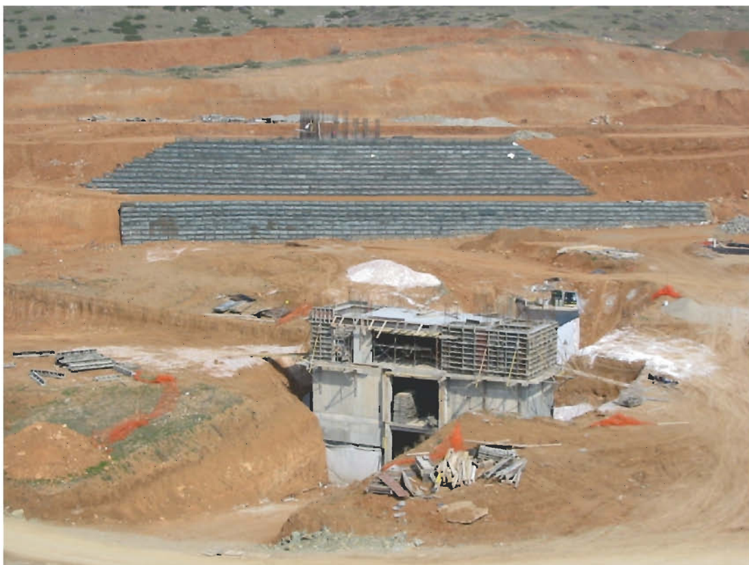
Φ22: Κατασκευή οπλισμένου επιχώματος 16 συνδετήριας οδού Α κόμβου Μετσόβου (Ε.Ο.Α.Ε., 1618 - Ιούλιος 2002)