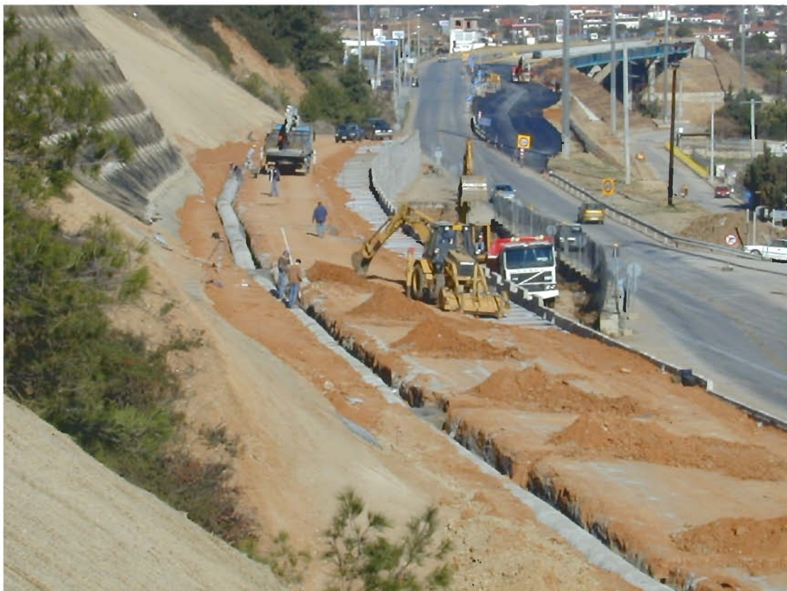
Φ17: Κατασκευή προσωρινού οπλισμένου επιχώματος για την μόνιμη σταθεροποίηση του ορύγματος με εδαφοηλώσεις στην περιοχή του αρχαιολογικού χώρου, Ποτίδαιας. (Ε.Ο.Α.Ε., 1513 – Ιούνιος 2001)