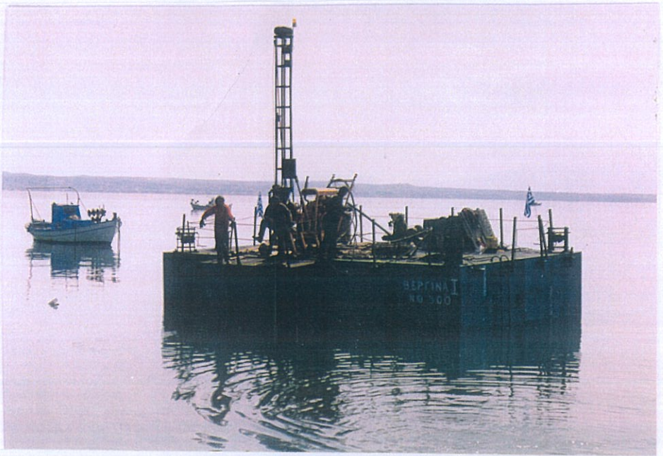
Φωτο 1: Θαλάσσια γεώτρηση Γ-1