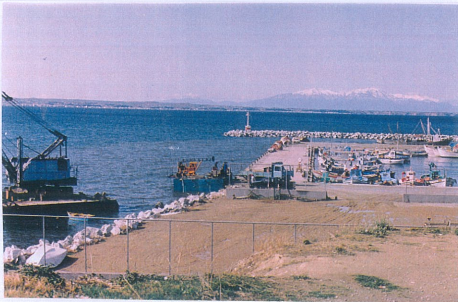
Φωτο 2: Καθέλκυση πλωτής εξέδρας