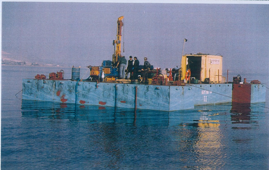
Φωτο 1 & 2 : Εκτέλεση θαλάσσιων γεωτρήσεων