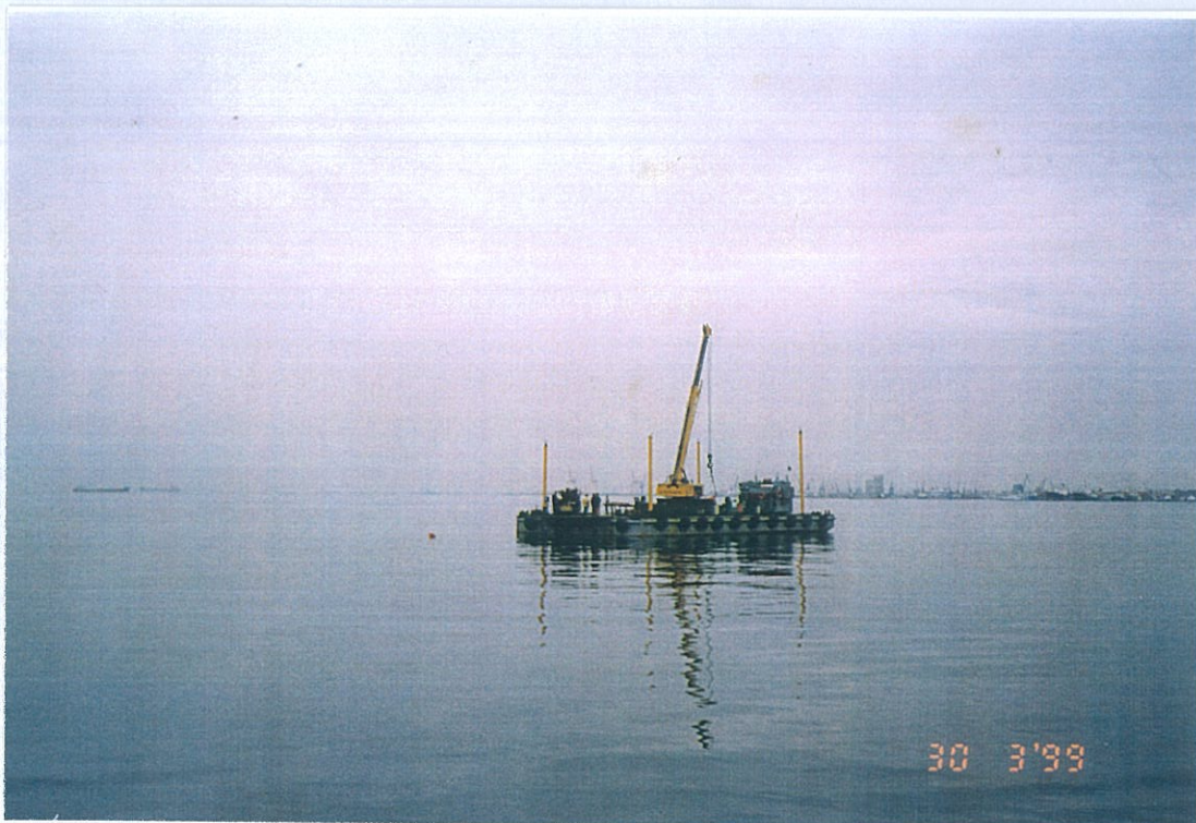
Φωτο 1 & 2: Εκτέλεση θαλάσσιων γεωτρήσεων