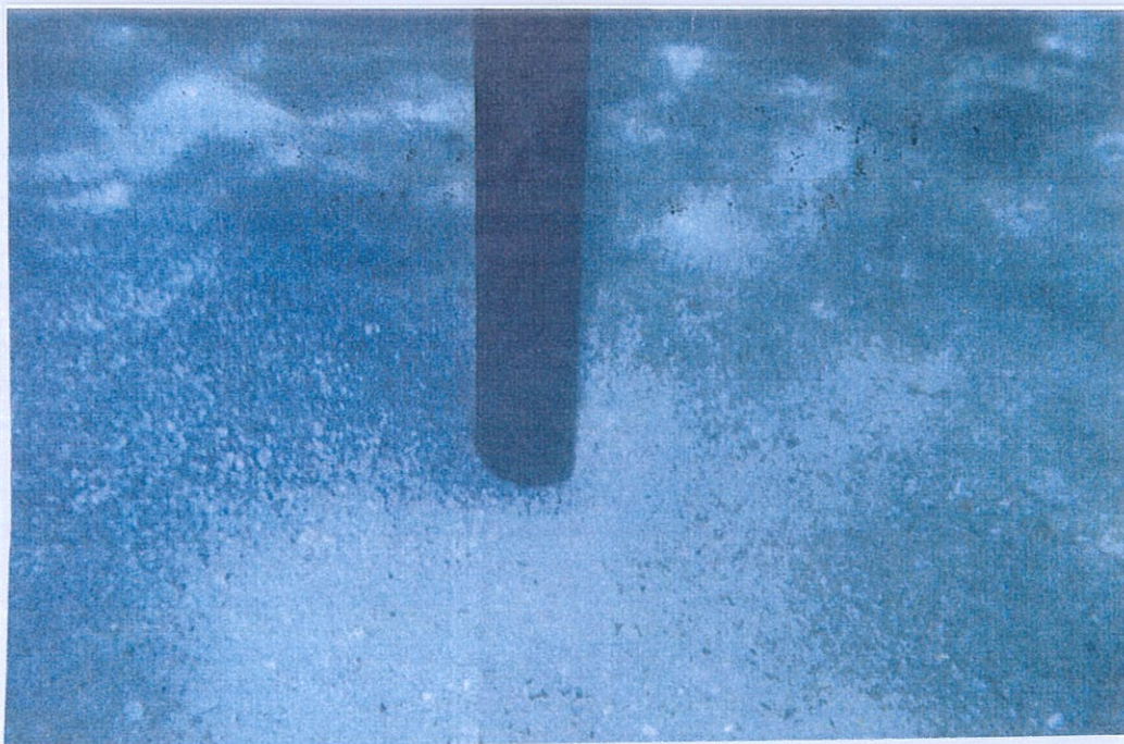
Φωτο 2: Θαλάσσια γεώτρηση Θ1, Υποβρύχια φωτογραφία της εξωτερικής σωλήνωσης της γεώτρησης. Διακρίνονται : α) Ο αμμοχαλικώδης πυθμένας. β) Τα χαλίκια (μπάζα) κατά την προχώρηση με νερό του σωλήνα, τα οποία συγκεντρώνονται στη μία μόνο πλευρά λόγω της ύπαρξης θαλάσσιου ρεύματος.