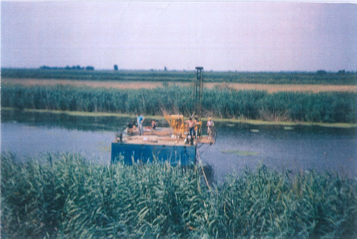
Φωτο 1 & 2: Γεώτρηση L-1. Διέλευση Λουδία Ποταμού.