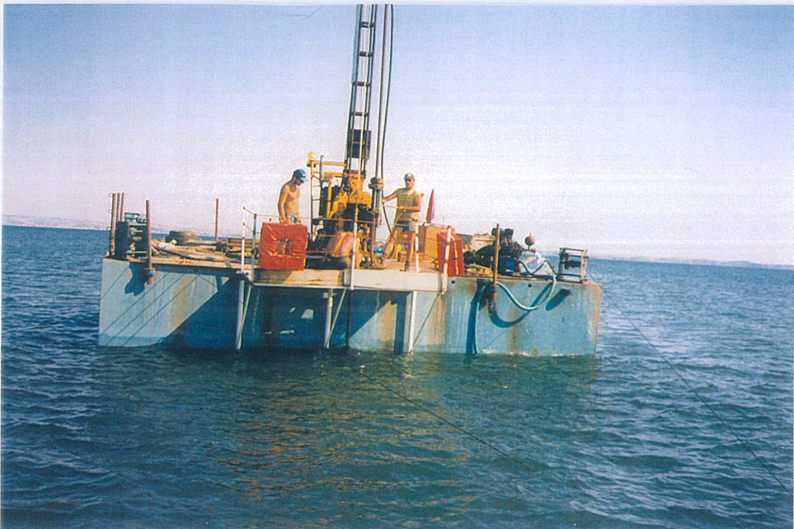
Φωτο 1 & 2: Εκτέλεση θαλάσσιων γεωτρήσεων