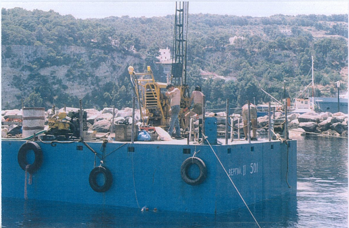
Φωτο 1 & 2 : Εκτέλεση θαλάσσιων γεωτρήσεων