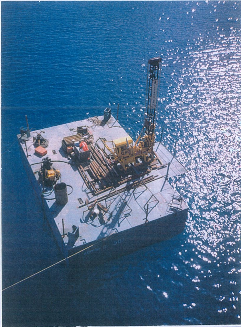
Φωτο 1: Πλωτή γεώτρηση Γ-1