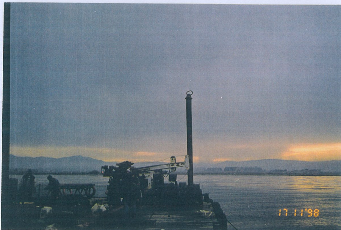
Φωτο 1 & 2: Εκτέλεση θαλάσσιων γεωτρήσεων