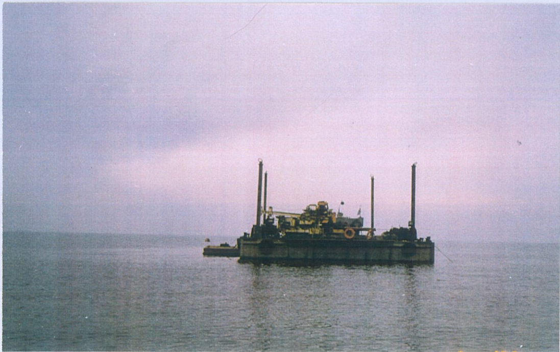
Φώτο 3 & 4 : Εκτέλεση θαλάσσιων γεωτρήσεων