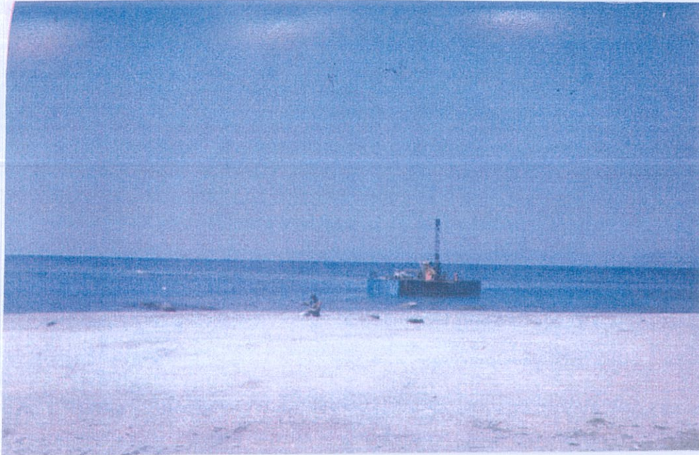
Φωτο 1: Θαλάσσια γεώτρηση Θ2